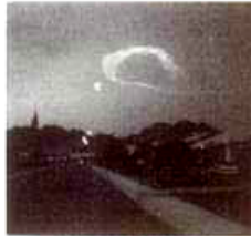
6:15 P.M., N. OF PHOENIX