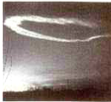
6:30 P.M., W.N.W. OF WINSLOW