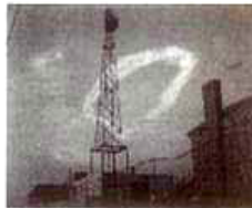
5:10 P.M., N.E. OF FRESCOTT