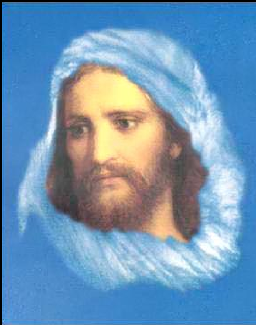
ప్రభువైన యేసు క్రీస్తు LORD JESUS CHRIST